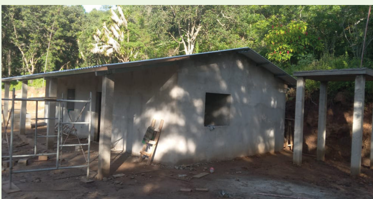
Das neue Casa de Salud „HILDE“ in Xejuyup.