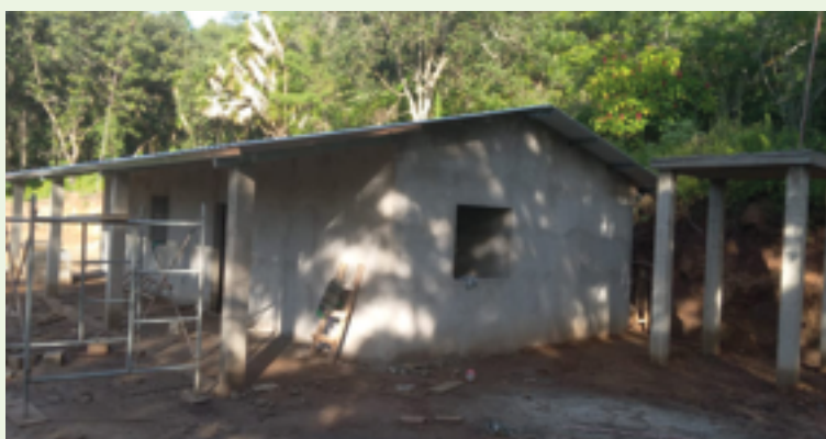
Das neue Casa de Salud „HILDE“ in Xejuyup.